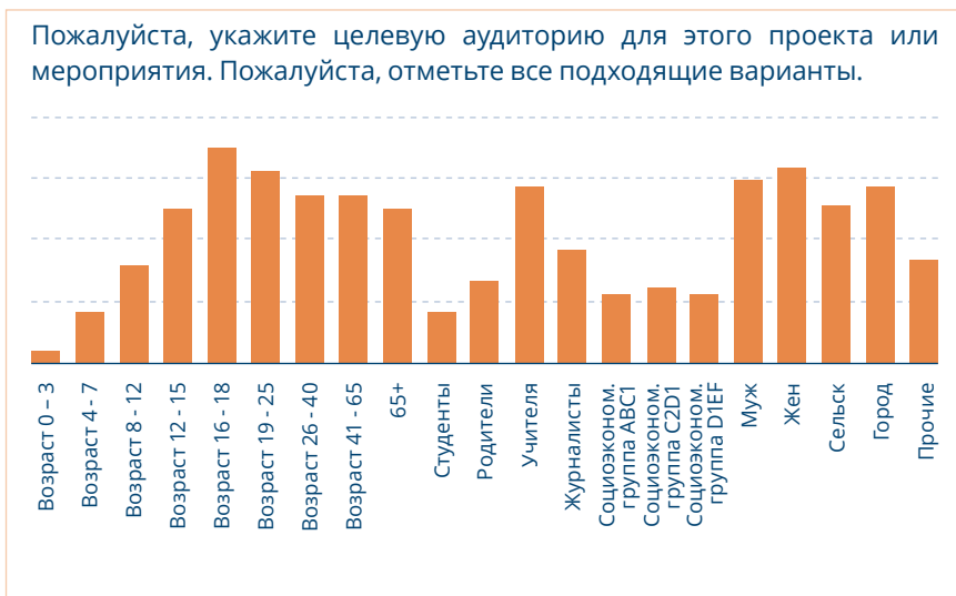
Рисунок 3. Целевая аудитория.

Примеры проектов, нацеленных на журналистов, приводятся во вставке «В центре внимания №3» выше — «Этичные СМИ для активной гражданской позиции» и в №7 ниже — «Национальный форум заинтересованных сторон» Монголии.